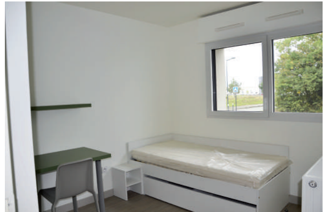
Exemple de chambre en logement duo

Le loyer moyen s'élève à 500 € charges comprises.