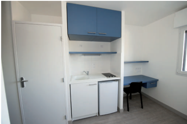
Exemple de studio

Le loyer moyen s'élève à 300 € charges comprises.